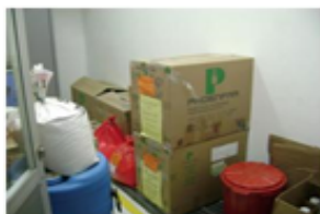
Foto No. 14. Centro de Acopio de residuos peligrosos

Los residuos administrativos como tóneres son enviados a una fundación y las luminarias se encuentran en almacenamiento.